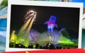
ห้ามพลาด ชมการแสดงพลุตระการตา