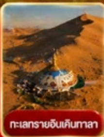
ทะเลทรายอินคินทาลา