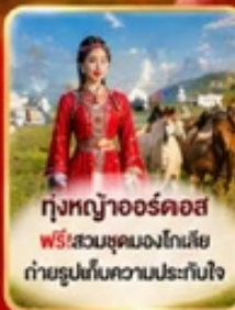
ทุ่งหญ้าออร์ดอส ฟรี! สวมชุดมองโกเลีย ถ่ายรูปเก็บความประทับใจ