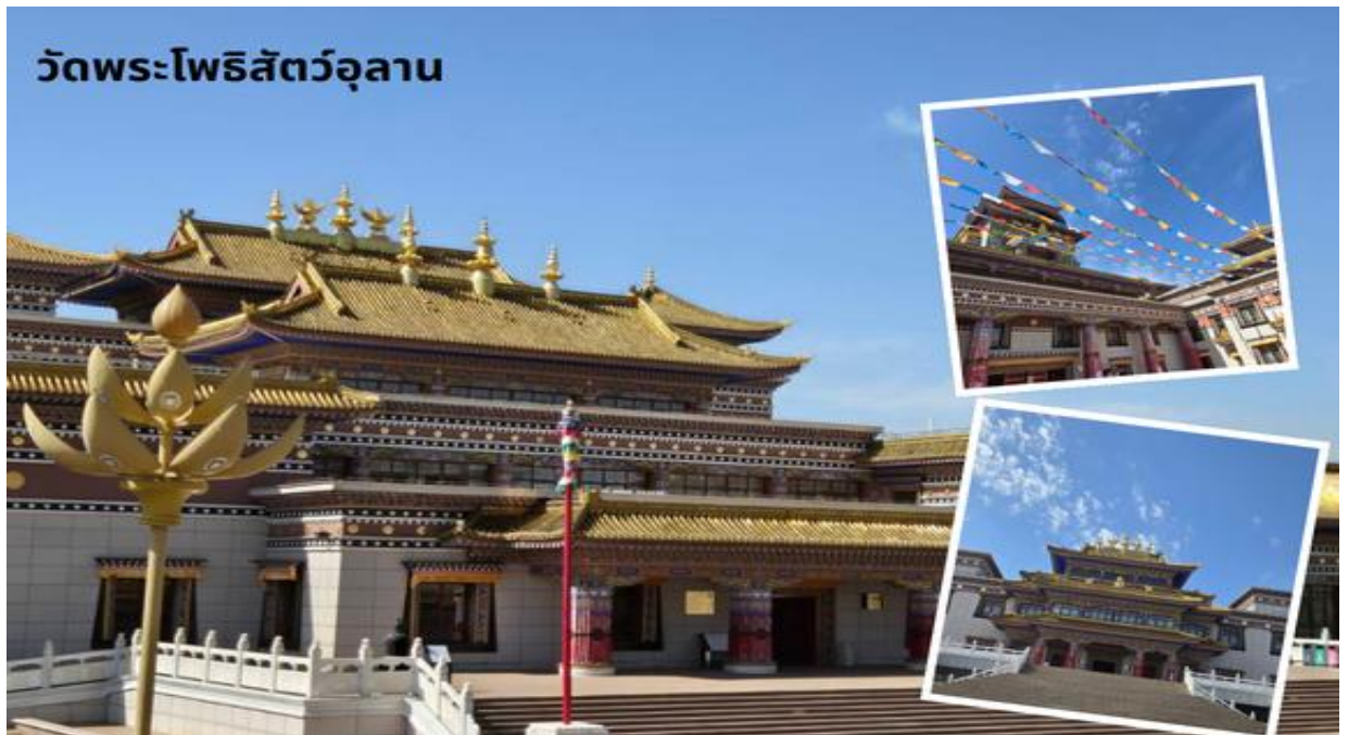
วัดพระโพธิสัตว์อุลาน

จากนั้นนำท่านสู่ วัดพระโพธิสัตว์อุลาน เป็นสถานที่ท่องเที่ยวระดับ 4A ครอบคลุมพื้นที่ประมาณ 20,000 ตารางเมตร รูปแบบอาคารเป็นสถาปัตยกรรมแบบผสมผสานมองโกล ทิเบต และฮั่น ภายในมีการจัดแสดงโบราณวัตถุทางวัฒนธรรมที่ยังคงมีความสมบูรณ์