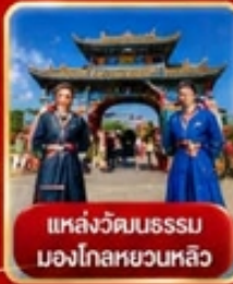
แหล่งวัฒนธรรม มองโกเลียหลวง