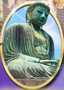
พระใหญ่คามาคุระ