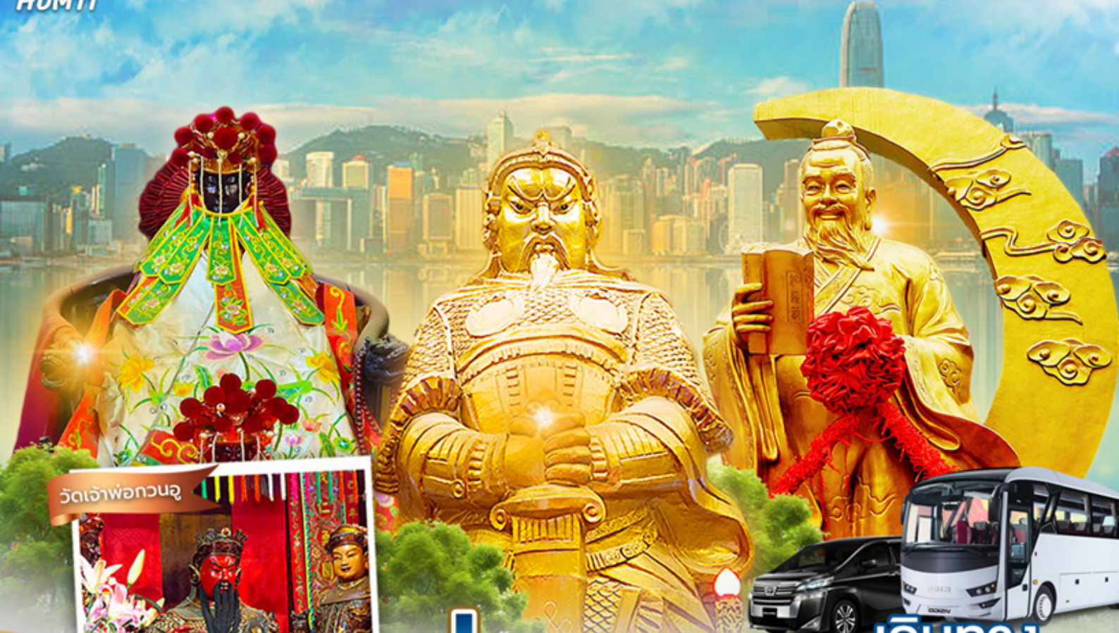
วัดเจ้าพ่อกวนอู