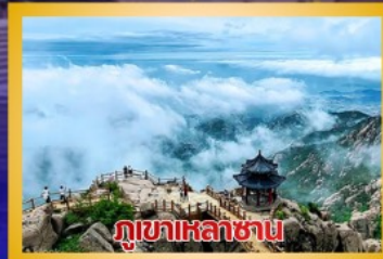
ภูเขาเหล้าซาน