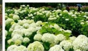
ชมดอกไม้เดรนเนียบ