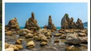
ชายหาดฮาชิคุอิ:

🧳 โหลด 23 KG. x2 ( รวม 46 KG. ) ทั้งไป - กลับ