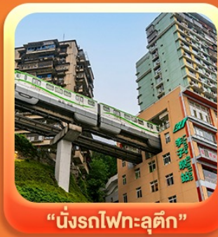
“นั่งรถไฟทะลุติ๊ก”