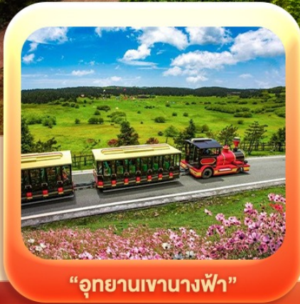
“อุทยานเขานางฟ้า”

✈ DMK-CKG FD556 (06.15-10.20) ✈ CKG-DMK FD557 (11.20-13.35)