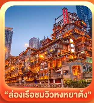
“ล่องเรือชมวิวหงหยาดัง”