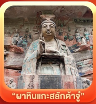
“ผาหินแกะสลักต้าจู้”

บึงตรงลงชิง • อุ้หลง หลุมฟ้าสะพานสวรรค์ • ระเบียบแก้ว • อุทยานเขานางฟ้า หงหยาดัง • นั่งรถไฟทะลุติ๊ก • ล่องเรือชมดวงชิงยามค่ำคืน • ศาลาประชาคม (ด้านนอก) มรดกโลกผาหินแกะสลักต้าจู้ • เมืองโบราณซือปาที • วัดหลิวฮั่น • ตึกตะเกียบ