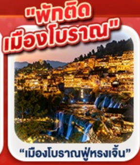
“เมืองโบราณฟู่หลงเจิ้น”