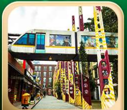
“ตงเจียวจี้”