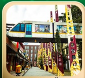
“ดงเจียวจี้”