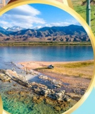
ล่องเรือทะเลสาบอิสซิค