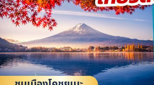
ชมเมืองโคชูยูเมะ