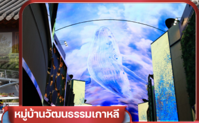
หมู่บ้านวัฒนธรรมเกาหลี