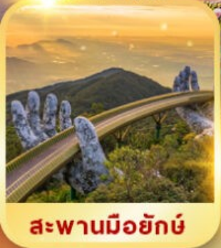
สะพานมือยักษ์