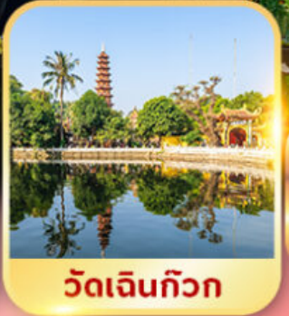
วัดเงินทิวก