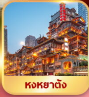
หงหย่าตัง