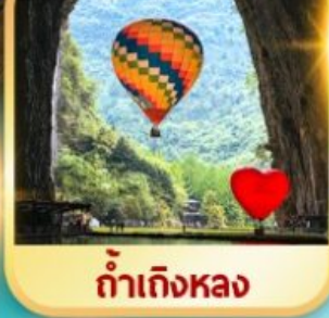
ท่าเตี๋ยหลง