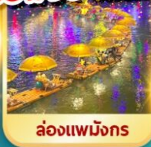
ล่องแพผิงซาน