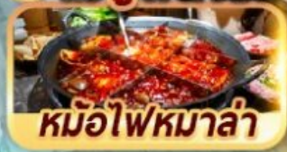
หม้อไฟหมาล่า