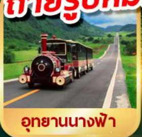
อุทยานนางฟ้า