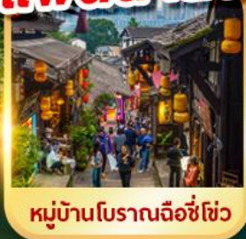
หมู่บ้านโบราณฉือชู่ฮั่ว