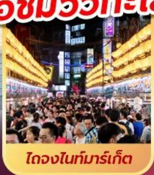
ไถจงไนท์มาร์เก็ต