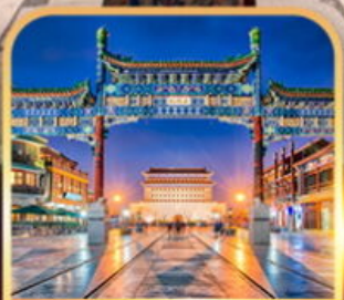
ถนนเจียนเหมิน