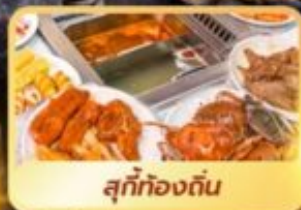
สุกี้ทองถิ่น