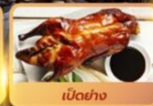
เป็ดย่าง