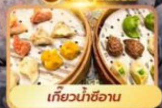
เกี้ยวน้ำซอ