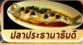
ปลาประธานาธิบดี