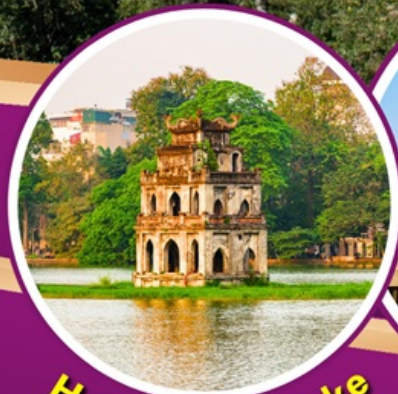
Hoan Kiem Lake