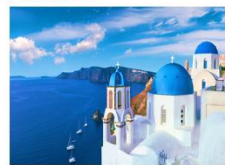
เกาะซานโตรินี่

** พักที่ Aelia Suites Karterados Hotel 4* หรือเทียบเท่า **