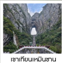
เขาทียนเหมินซาน

ฉลองเที่ยวบินปฐมฤกษ์ เก็บครบทุกไฮไลต์!! วันที่ 10 พฤษภาคม 2569 กรุงเทพฯ - อางซา (จางเจียเจีย)