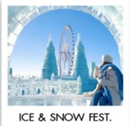
ICE & SNOW FEST.