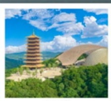
ภูเขาหนิวโถ้วซาน