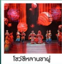
โชว์ซีหลานซาฝู