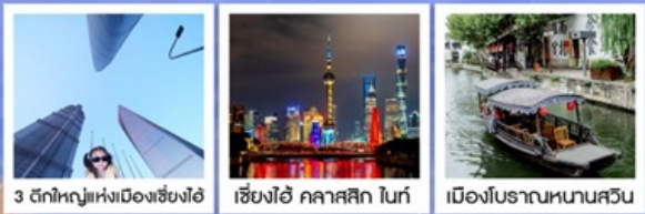
3 ตลาดใหญ่แห่งเมืองเซี่ยงไฮ้ | เซี่ยงไฮ้ คลาสสิก ไทท์ | เมืองโบราณหนานสวิน