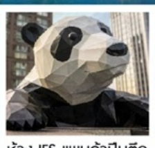
ห้าง IFS แพนด้าป็นตึก

จัดทริปหย่างเก๋ย่นวู้ / รูปปั้นหมีแพนด้าเซลฟี / เมืองโบราณก้วนเซี่ยน คำธารสีฟ้า / อุทยานภูเขาสีดรุณี / อุทยานชวงเฉียวโกว (รวมรถอุทยาน) อุทยานπίงผิงโกว (รวมรถอุทยาน + รถแบตเตอร์) / อุทยานจิวจ้ายโกว (รวมรถเหมา) ถนนคนเดินชุนชู่ / ห้าง IFS แพนด้าป็นตึก / ถนนคนเดินไท่กู่หลี่ ถนนคนเดินชอยกว้างแคบ (POP MART)