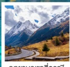
อุทยานภูเขาสีดรุณี