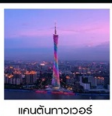
แคนตันทาวเวอร์