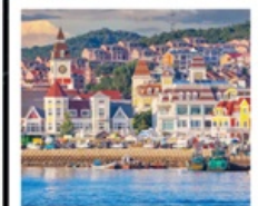
ท่าเรือประมงเหยียนโกะ