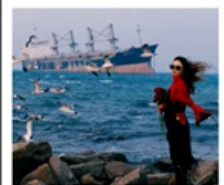
เรือลิวส์

หอคอยทาลเวลา / รูปปั้นปลาวาฬ / ถนนโบราณเตาหยาง / ย่านสงโขว่ 1920 / เมืองเว่ยไห่ / ถนนฮั่วจวีปา / จตุรัสประตูแห่งความสุข ย่านฮั่นลอฟ่าง / เรือลิวส์ / หาดซาจ้อฮั่ว / ถนนหลงเจียง / สะพานจันเจียว / หาดไซเบอร์ No. 3 ถนนจงซาน / โบสถ์ St.Emill / จตุรัส 54 / ศูนย์เรือใบโอลิมปิก / พิพิธภัณฑ์เบียร์ชิงเต่า / ถนนโก่ตง / ท่าเรือประมงเหยียนโกะ