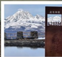
ปาหลางดิงตู