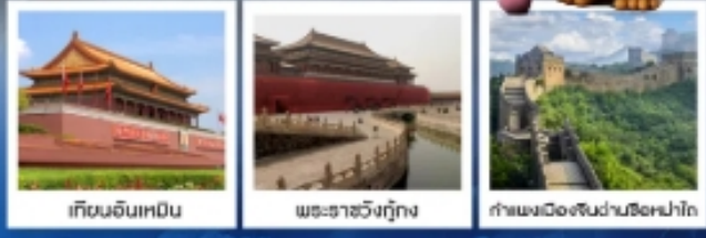
เทียนอันเหมิน พระราชวังกู้กง กำแพงเมืองจีนผ่านซือหม่าโต

เมืองโบราณกู่เป่ย์สุ่ยเจิ้น / กำแพงเมืองจีนด่านซือหม่าโต (รวมค่ากระเช้าขึ้น-ลง) / ชมวิวกำแพงเมืองจีนและเมืองโบราณ ยูนิเวอร์แซลปักกิ่ง (รวมค่าบัตรเข้า) / จตุรัสเทียนอันเหมิน / พระราชวังโบราณกู้กง / หอบูชาเทียนถาน คาเฟ่กาแฟบ้านน้ำตาด (TANG FANG CAFE) / พระราชวังฤดูร้อนอวิ๋เหอหยวน / ย่านชานหลี่ถุน (POP MART) / ถนนคนเดินไท่กุ่หลี่