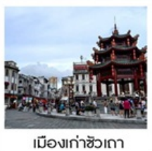
เมืองเก่าซัวเถา