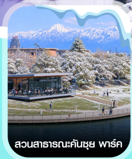
สวนสาธารณะคันซุยุ พาร์ค