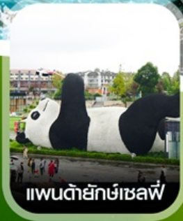
แพนด้ายักษ์เซลฟี่

คอนเฟิร์ม ออกเดินทาง ทุกพีเรียด 2 ท่านขึ้นไป