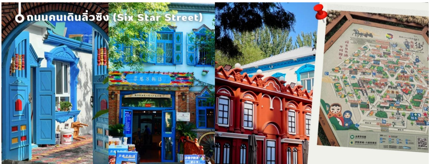
○ ถนนคนเดินลิวซิง (Six Star Street)

จากนั้นนำทุกท่านเพลิดเพลินกับ ถนนคนเดินลิวซิง (Six Star Street) แลนด์มาร์คสำคัญของเมืองอีหนิง สร้างขึ้นตั้งแต่ปี ค.ศ. 1934 โดยออกแบบเป็นผังรูปดาว 6 แฉก ภายในเต็มไปด้วยบ้านสไตล์ซินเจียงสีสดใสโดดเด่นด้วยผนังสีฟ้า หลังคาสีชมพู และสวนดอกไม้ที่สวยงาม ให้บรรยากาศราวกับเมืองในเทพนิยาย ที่นี่สะท้อนความหลากหลายทางวัฒนธรรมของชาวอุยกูร์ คาซัค หุย และรัสเซีย นักท่องเที่ยวสามารถชมการแสดงพื้นเมือง ฟังดนตรีซินเจียงจากหีบ