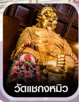
วัดเชกหมิว