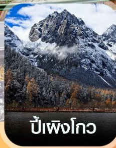
ปีเหมิงโกว

✈️ คอนเฟิร์มออกเดินทาง ทุกปีเรียด 2 ท่านขึ้นไป