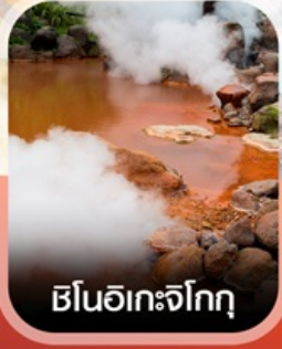
ชินอิเกะจิกุ

✈️ คอนเฟิร์ม ออกเดินทาง ✈️ ทุกพีเรียด 2 ท่านขึ้นไป