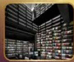
ชมร้านหนังสือ