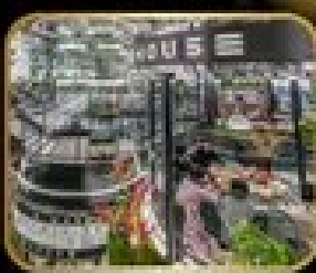
อาคาร 3 ชั้น WAREHOUSE NO.3