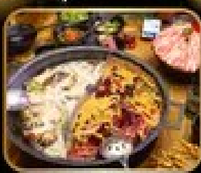
พาสตากับซอสไฟ สุกี้ หม้อไฟสไตล์จีน