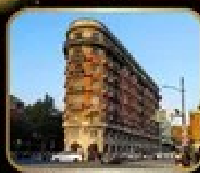
ตึกหรูใจกลางเมือง WUKANG MANSION