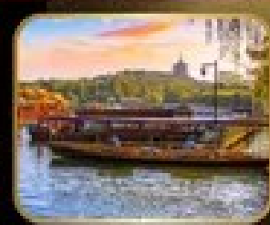
ล่องเรือ ทะเลสาบอูหู