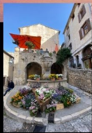
พรอวองซ์