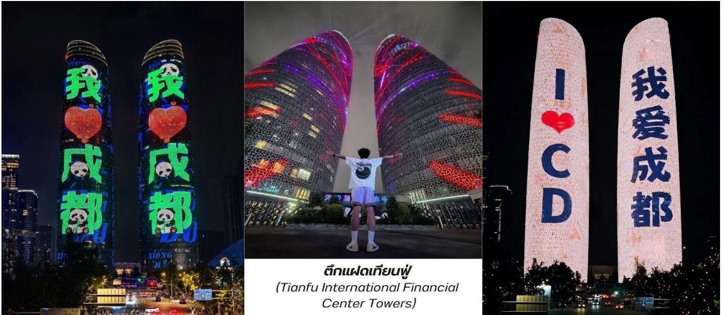
ตึกแฝดเทียนฟู (Tianfu International Financial Center Towers)

จากนั้นพาท่านไป ช้อปปิ้งที่ห้างหรู SKP แลนด์มาร์คที่ล้ำสมัยที่สุดในเมืองเฉิงตูเวลานี้ ห้างสรรพสินค้าลึกลับที่มิได้แค่ขายของแบรนด์เนมแต่คือการปฏิวัติวงการสถาปัตยกรรมด้วยคอนเซ็ปต์สวนสาธารณะบนดิน ห้างหรูใต้ดิน" บนพื้นที่รวมกว่า 5 แสนตารางเมตร ความพิเศษที่ทำให้ Chengdu SKP แตกต่างจากที่อื่นคือการสร้างห้างลึกลงไปใต้ดินถึง 5 ชั้น โดยที่พื้นที่ระดับพื้นดินถูกเปลี่ยนเป็นสวนสาธารณะสีเขียวขนาดใหญ่