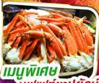
เมนูพิเศษ บุฟเฟ่ต์ขาปูยักษ์

35,999 ราคาเพียง *รวมภาษีมูลค่าเพิ่มแล้ว*