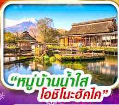
“หมู่บ้านน้ำใส โอะชิโนะฮาคิโค”