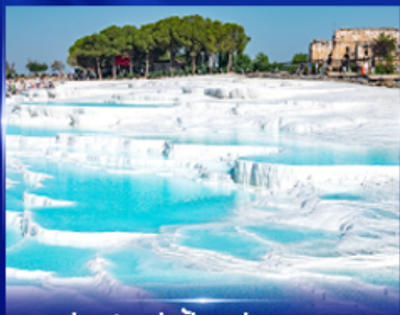
ปราสาทบุษบ้ายา บามุกคาเล