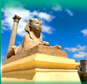
เสาริมันปอมเปย์