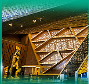
พิพิธภัณฑ์เกรนด์อียิปต์ (GEM)