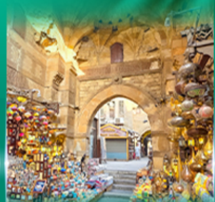
ตลาดผ่านเอลคาลิซี