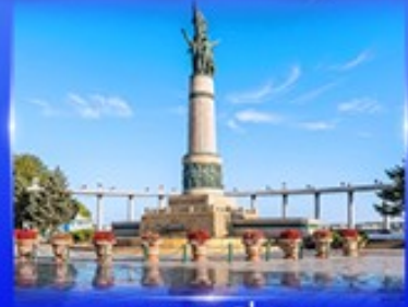
อนุสาวรีย์นิ่มหง