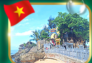
สักการะขอพรศาลเจ้าดิวงกา