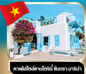
คาเฟ่สไตล์ชิคาโกริมน้ำ ชันตรา เทริน่า