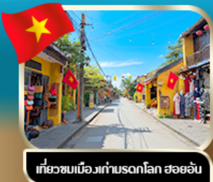
เที่ยวชมเมืองเก่ามรดกโลก ฮอยอัน