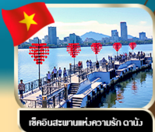
เช็คอินสะพานแห่งความรัก ดานัง