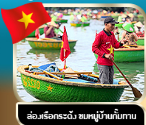
ล่องเรือกระด้ง ชมหมู่บ้านก๊อบกาน