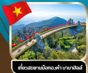
เที่ยวสะพานมังกรทองคำ บานาฮิลล์

ราคานี้อยู่ไปรวม 1,000 เก็บที่สนามบิน รวมแล้วเริ่ม 12,888 ถูกที่สุดแน่นอน